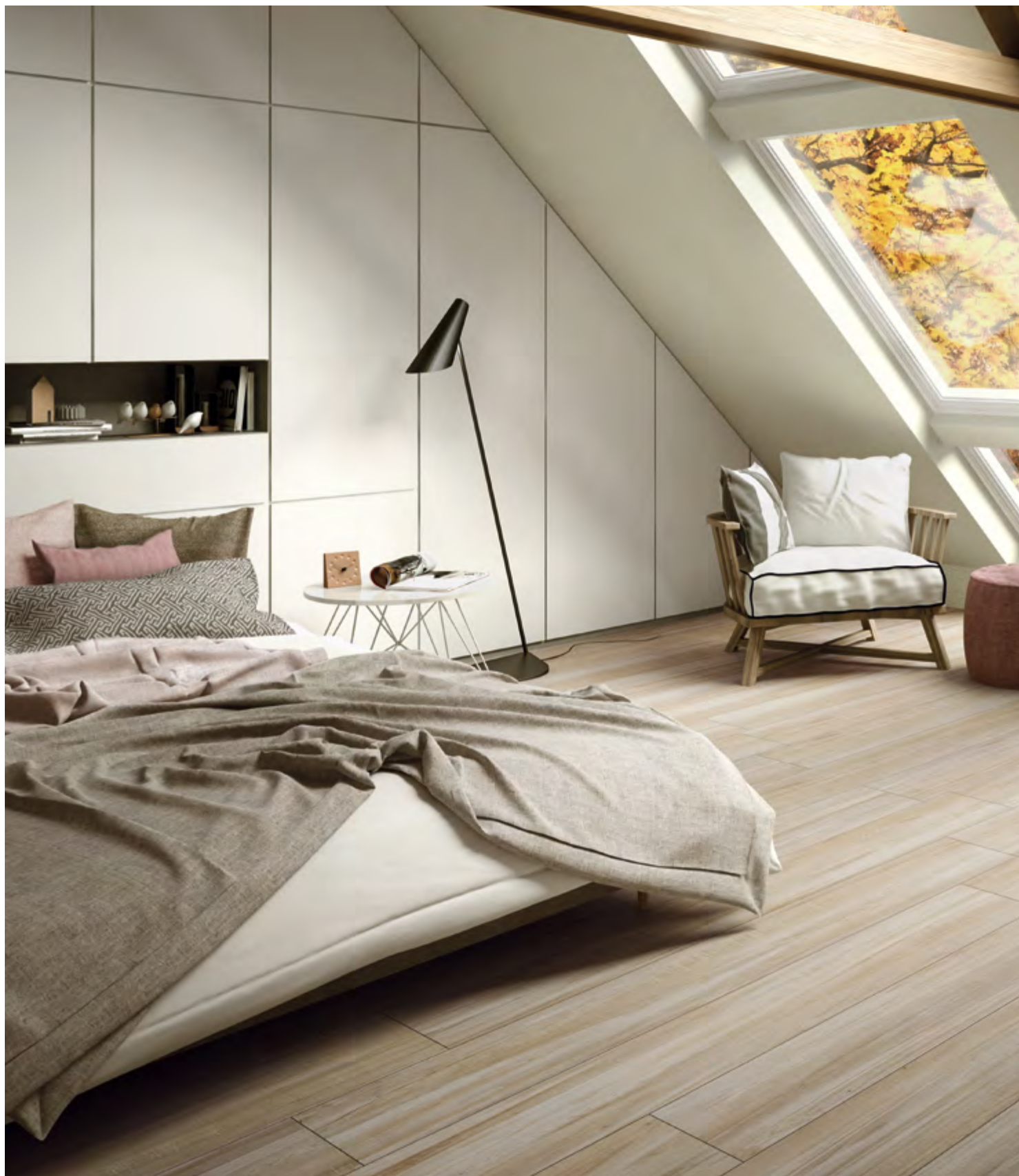
FLOOR: white oak cm 22,5x180 - 8 7/8 "x70 7/8 "