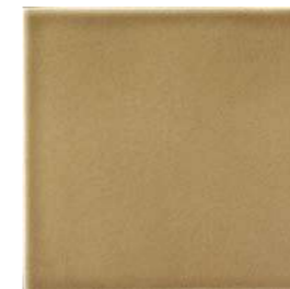
20x20x1 Noix Cr. MAI4 - 94 MQ