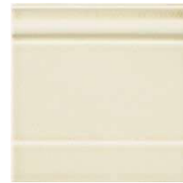
20x20x2 Zoccolo Ivoire Cr. ZOM2 - 105 PZ