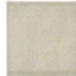
20x20x1 Argent Cr. MAI3 - 94 MQ