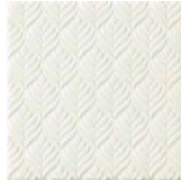
20x20x1 Marais Blanc Cr. MAR1 - 132 MQ