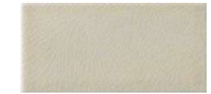
10x20x1 Argent Cr. MAI300 - 91 MQ