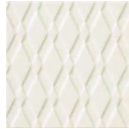
20x20x1 Pigalle Blanc Cr. PIG1 - 132 MQ