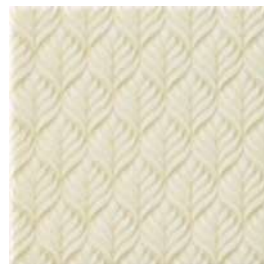
20x20x1 Marais Ivoire Cr. MAR2 - 132 MQ