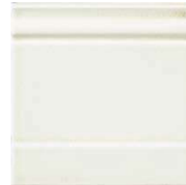
20x20x2 Zoccolo Blanc Cr. ZOM1 - 105 PZ