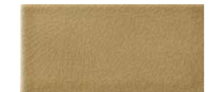
10x20x1 Noix Cr. MAI400 - 91 MQ