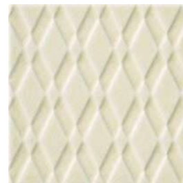
20x20x1 Pigalle Ivoire Cr. PIG2 - 132 MQ