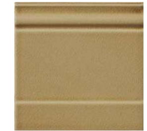
20x20x2 Zoccolo Noix Cr. ZOM4 - 105 PZ