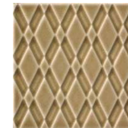
20x20x1 Pigalle Noix Cr. PIG4 - 132 MQ