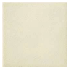
20x20x1 Ivoire Cr. MAI2 - 94 MQ