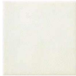
20x20x1 Blanc Cr. MAI1 - 94 MQ