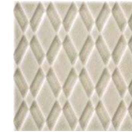
20x20x1 Pigalle Argent Cr. PIG3 - 132 MQ