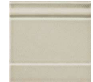
20x20x2 Zoccolo Argent Cr. ZOM3 - 105 PZ