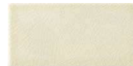
10x20x1 Ivoire Cr. MAI200 - 91 MQ