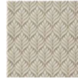
20x20x1 Marais Argent Cr. MAR3 - 132 MQ