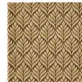
20x20x1 Marais Noix Cr. MAR4 - 132 MQ